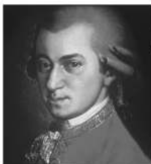
W.A. MOZART 1756-1791