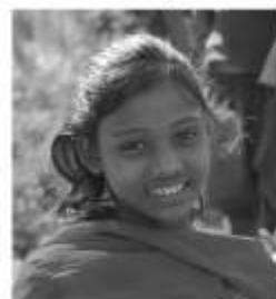
uśmiech z Nepalu