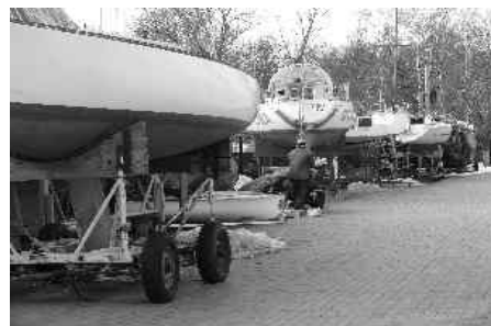
Wiosna w Górkach