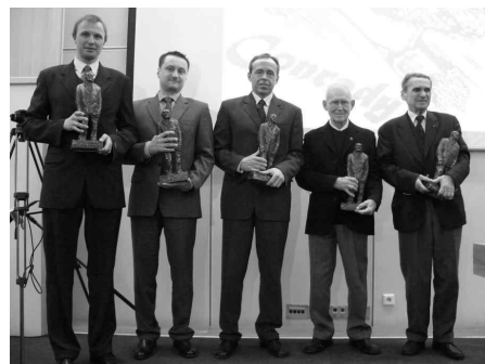
Laureaci „Conradów”

rocznym rejsie. Zwycięzcami zostali żeglarze pływający sami, na małych jachtach i nawet nie zahaczający o polskie porty.